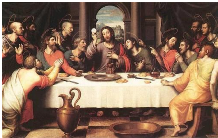
Тайная вечеря, Хуан де Хуанес, Мадрид, Музей Прадо, ок. 1562 г.

Сказание о Граале стоит начать с классического момента его явления. Накануне своей смерти, Иисус из Назарета на Тайной вечери, вознеся потир, произнес: «Сия Чаша есть Новый Завет в Моей Крови, которая за вас проливается» [Лк. 22:20]. Романтическая традиция рыцарских романов способствовала ответвлению сюжетной линии известных событий. Согласно роману, Joseph d'Arimathie (1215 г.) французского поэта Робера де Борона, Иосиф Аримафейский собрал кровь, сочившуюся из ран Спасителя, в потир. Тем самым тайный ученик Христа стал родоначальником мистерии Грааля и первым жрецом данного культа [Эвола, 2013: 78]. Роман переплетается с апокрифическим Евангелием от Никодима, как бы дополняя его. Так, за воздаяние преданности и благодарности своему учителю,