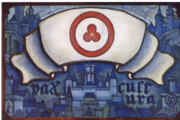
Рах Cultura, Н.К. Рерих, 1931 год.