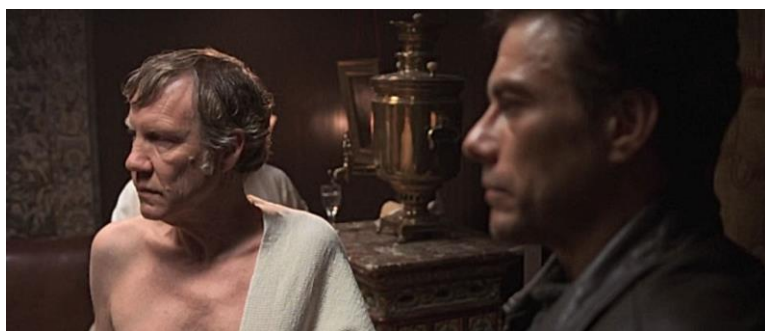
Рис. 2. Киров. Максимальный риск (Maximum Risk) (1996)

Например. Тедди КГБ. Тедди говорит с ярко-выраженным акцентом по-английски, носит бороду. В его кабинете висят русские расписные часы под хохлому (Шулеры (Rounders) (1998).