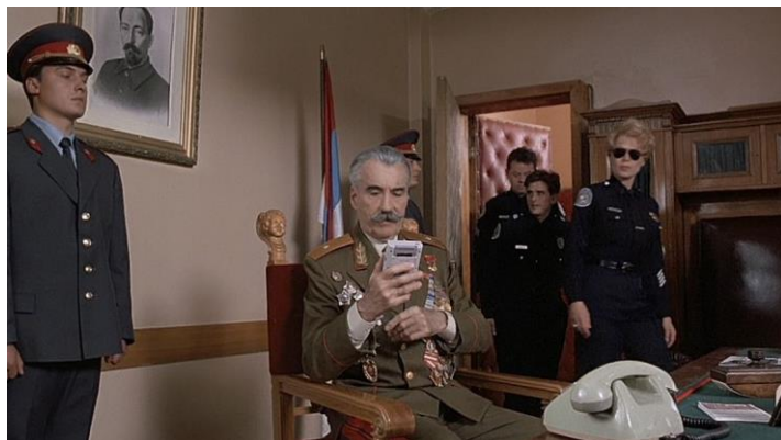
Рис. 6. Раков. Полицейская Академия 7: Миссия в Москве (Police Academy: Mission To Moscow) (1994)

Во фрагменте фильма, проанализированного выше, фигурируют также культурные исторические (географические) стереотипы : Красная площадь, Спасская башня.