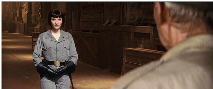
Рис. 5. Ирина Спалько. Индиана Джонс и Королевство Хрустального Черепа (Indiana Jones And Kingdom Of Crystal Skull) (2007)

Например. Ирина Спалько . Трижды награжденная Орденом Ленина и герой социалистического труда, одета в военную форму, имеет саблю, часто угрожает холодным оружием, разбирается в археологии, говорит по-английски с заметным русским акцентом, водку не пьет, не очень метко стреляет из «Калашникова» (Индиана Джонс и Королевство Хрустального Черепа (Indiana Jones And Kingdom Of Crystal Skull) (2007)).