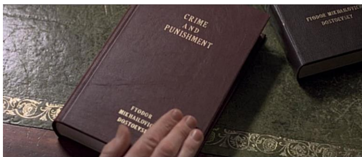
Рис. 7. Максимальный риск (Maximum Risk)(1996)

Культурные стереотипы : гармонь, Ф.М. Достоевский, икона (Пресвятая Богородица), «Катюша», балалайка («Яблочко, куда катишься»), «Лебединое озеро», газета «Правда».