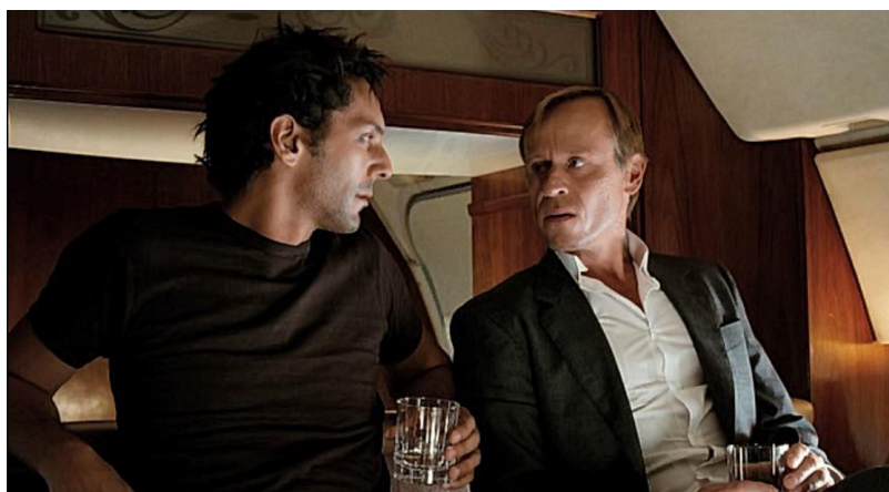
Рис. 4. Корский. Ларго Винч: Начало (The Heir Apparent: Largo Winch)(2008)

Капитан Гуднайев. Руководит петербургской милицией. Зовет следователя из Интерпола выпить кофе, но на самом деле пьют водку (Хитмэн (Hitman) (2007).