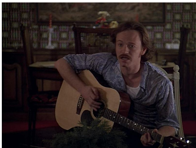
Рис. 1. Влад. Счастье (Happiness) (1998)

Данный перечень персонажей свидетельствует о том, что наиболее яркие ассоциации с русской жизнью и наиболее плодотворные образы вызывают такие сферы деятельности, как преступность (мафия, торговля оружием и пр.) , безопасность (КГБ, ФСБ, армия) , власть (президент) , космос (космонавт) , бизнес (олигарх, инвестор) , спорт (шахматы) , наука . Из персонажей 21 фильма всего один – Влад – оказался простым обывателем, эмигрантом и таксистом.