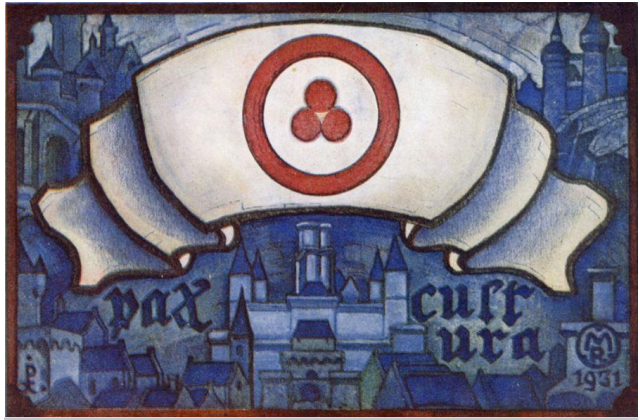
Рах Cultura, Н.К. Рерих, 1931 год.