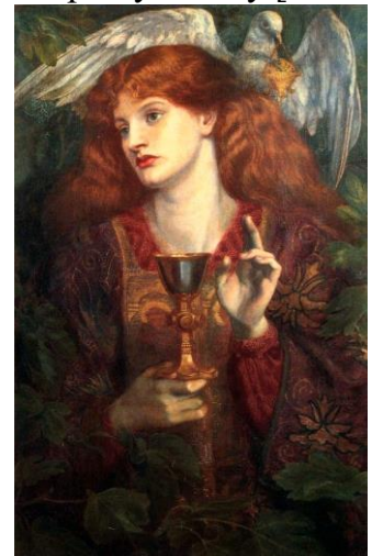
Дева Святого Грааля, Данте Габриэль Россетти, 1874 год.

Картина Данте Габриэля Россетти «Дева Святого Грааля» будоражит сознание и наиболее точно отражает женственность Чаши.