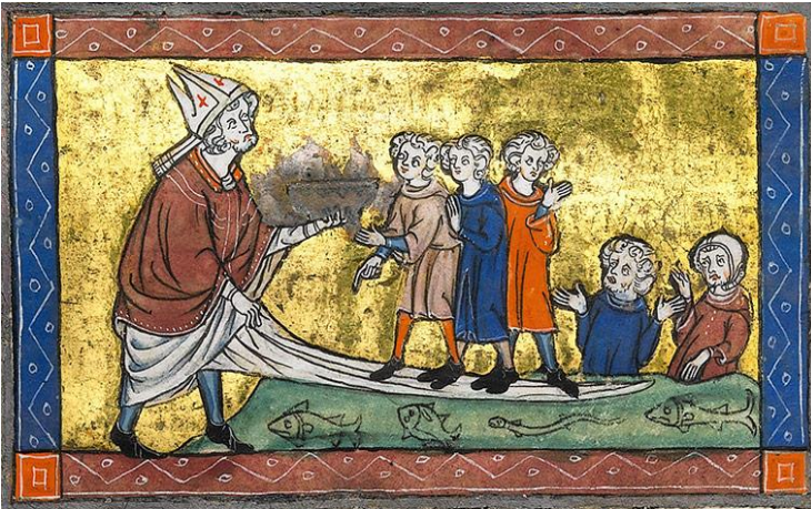
Иосиф Аримафейский перевозит Грааль в Англию, манускрипт Rochefoucauld Grail, XIV век.

Иосиф был заключён в темницу без еды и питья [Евангелие от Никодима, 2022: 166], но Чаша питала его своим содержимым, причастив к себе.