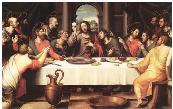
Тайная вечеря, Хуан де Хуанес, Мадрид, Музей Прадо, ок. 1562 г.

Сказание о Граале стоит начать с классического момента его явления. Накануне своей смерти, Иисус из Назарета на Тайной вечери, вознеся потир, произнес: «Сия Чаша есть Новый Завет в Моей Крови, которая за вас проливается» [Лк. 22:20]. Романтическая традиция рыцарских романов способствовала ответвлению сюжетной линии известных событий. Согласно роману, Joseph d'Arimathie (1215 г.) французского поэта Робера де Борона, Иосиф Аримафейский собрал кровь, сочившуюся из ран Спасителя, в потир. Тем самым тайный ученик Христа стал родоначальником мистерии Грааля и первым жрецом данного культа [Эвола, 2013: 78]. Роман переплетается с апокрифическим Евангелием от Никодима, как бы дополняя его. Так, за воздаяние преданности и благодарности своему учителю,