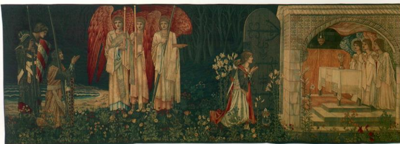
Видение Святого Грааля сэром Галаадом, сэром Борсом и сэром Персевалем, Эдвард Коли Бёрн-Джонс, 1898 год.

Сюжет поиска и обретения Грааля тесно переплелся с местными легендами, что способствовало рождению феномена куртуазного романа. Чаша представляет собой трансцендентный элемент, благодаря которому рыцарство обрело свою завершённость [Эвола, 2013:47]. Средневековые мастера литературного искусства – Вольфрам фон Эшенбах, Кретьен де Труа, Робер де Борон, Томас Мэлори и другие; отразили в своих произведениях религиозно-культурный синтез традиций учения Sangrael. Подвижники короля Артура, стали персонифицированным вечным стремлением к соприкосновению с непостижимо великой сущностью, а он – королём былого и грядущего [Мэлори 2023: 1008].