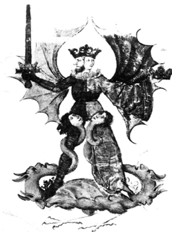
Алхимический андрогин-ребис, XV век.

Тем не менее, стоит помнить, что трансцендентные символы априори не могут иметь половой принадлежности. Они существуют вне времени и пространства. Любая материальная интерпретация есть лишь порождение человеческой фантазии и отражение характера действительного времени. Абсолюты, подобные Граалю, сочетают в себе лучшие качества обоих начал, как персонаж древнегреческой мифологии – Андрогин. Философ Платон в диалоге «Пир» описывал это существо как представителя третьего пола, который состоял из мужского и женского, и был наделён неимоверно большой силой. Боги разделили его, тем самым создав тень возле человека и