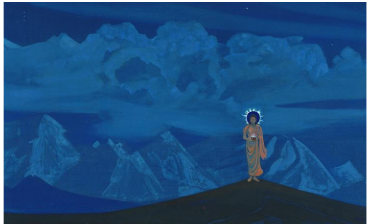
Чаша Будды, С.Н. Рерих, Рига, 1934 год.

Предания о Граале существуют в самых разных, территориально и культурно отдалённых уголках нашей планеты. Поскольку Он – доказательство единства всех вер и религий. Символ Чаши, процветший пламенем, присутствует во всех древних и современных культурах, имеющих огненную сущность [Шустова, 2018: 132]. В обрядах