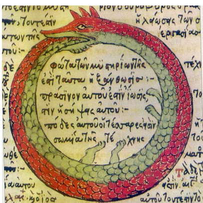
Изображение символа «uroboros» из алхимического трактата Феодора Пелеканоса, 1478

внутреннего божественного первоначала, а значит показал человеку дорогу к самому себе.