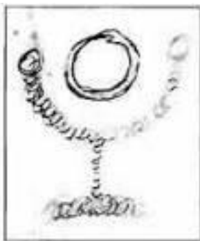
Чаша Грааля, рисунки Н.К. Рериха.

сделана из драгоценного камня. В ней написаны три стиха самарскими письменами, и никто истолковать их не может» [Рерих, 2022: 185].